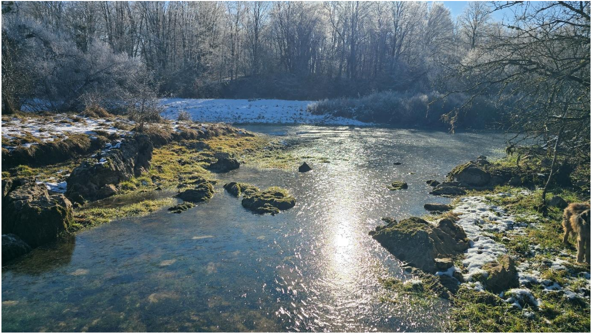
Поглед према главном току са притока из Граовчеве пећине....