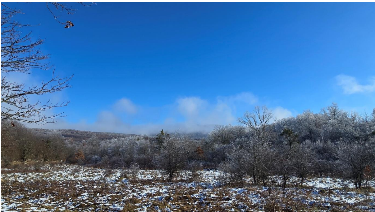
Прилазимо Јадови – поглед према Радловцу.