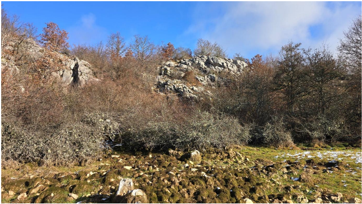
Излаз из Пећине у корито.