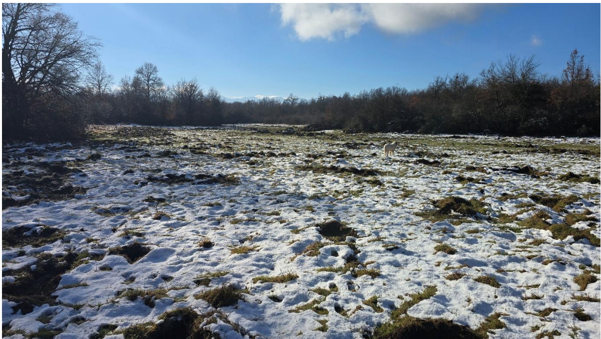
Поглед низводно на корито притоке. Сјеновити дио још под снијегом.