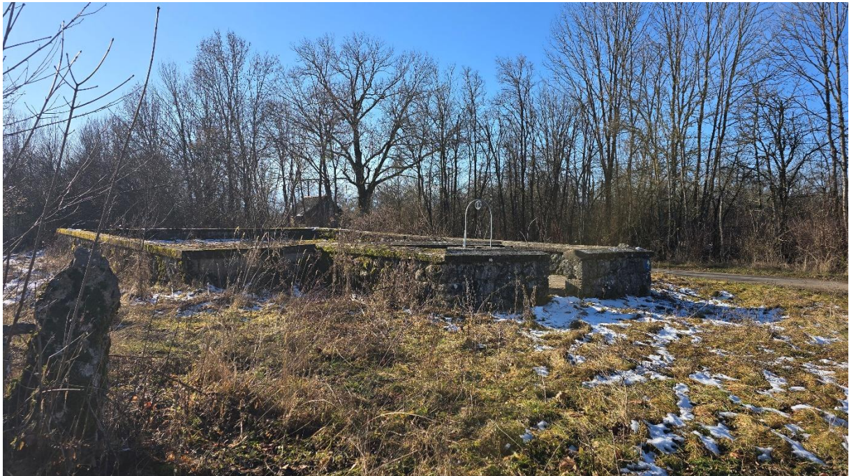
И коначнои долазимо на асфалт...