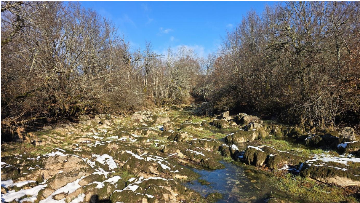
...који је безводан. Пећина још није потекла.