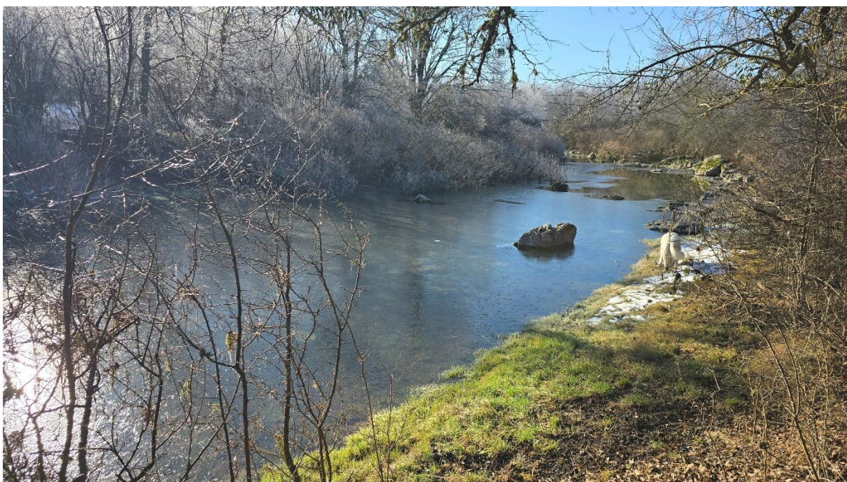
Јадова испод Саставака – тече