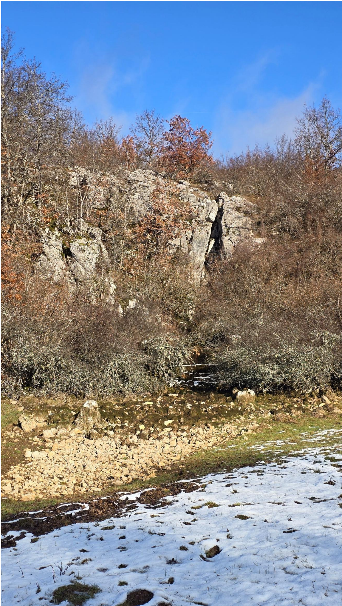
И коначно, поглед на усјеклину Пећине...