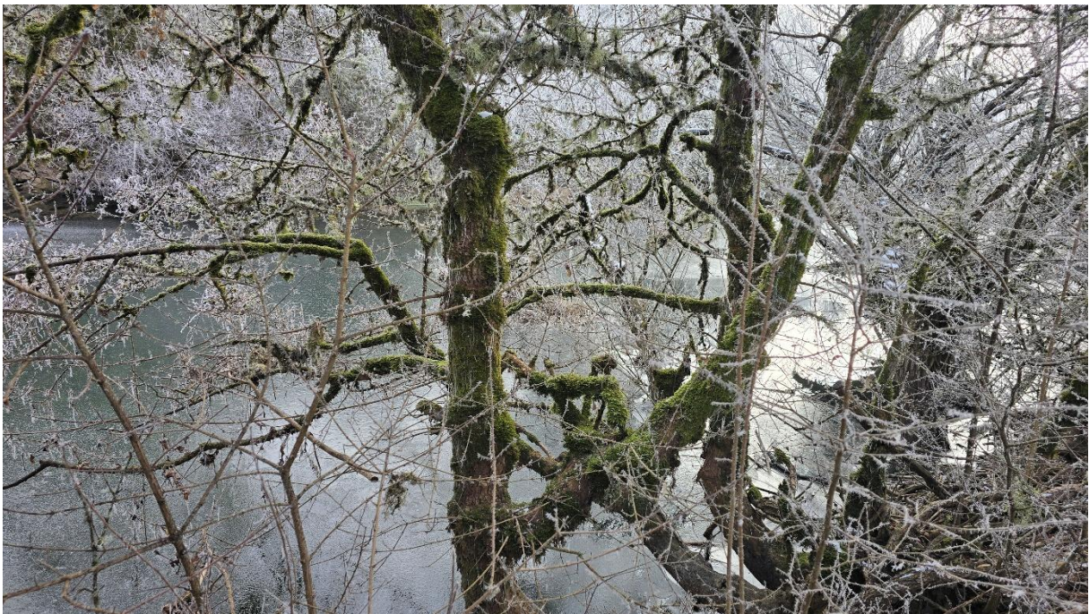
Ћоринац – поглед кроз врбе....