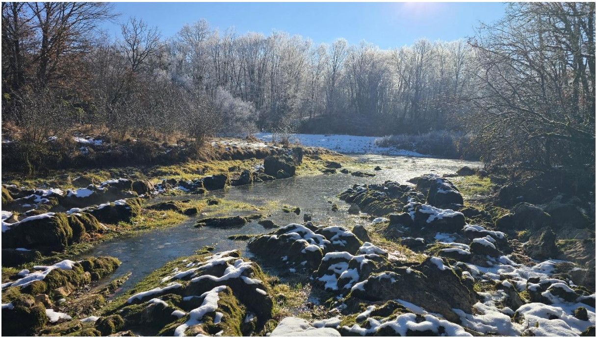
Још један поглед према Саставцима од притоке Пећине...