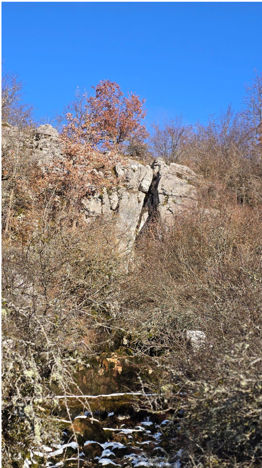
...у којој се назире Ступа и испрано камење обрасло маховином.