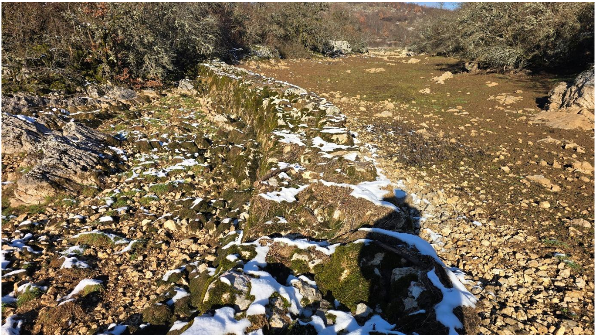
...и на брану са погледом узводно у правцу Граовчеве пећине...