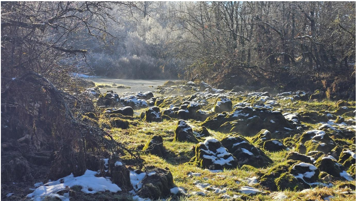
...и још један