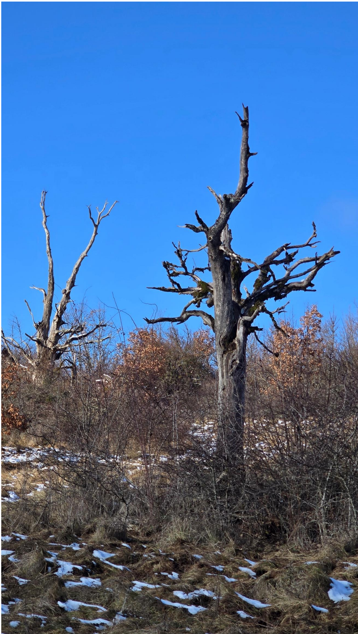
Осамљени, осушени остаци некад поносног дрвећа стрше у зрак...