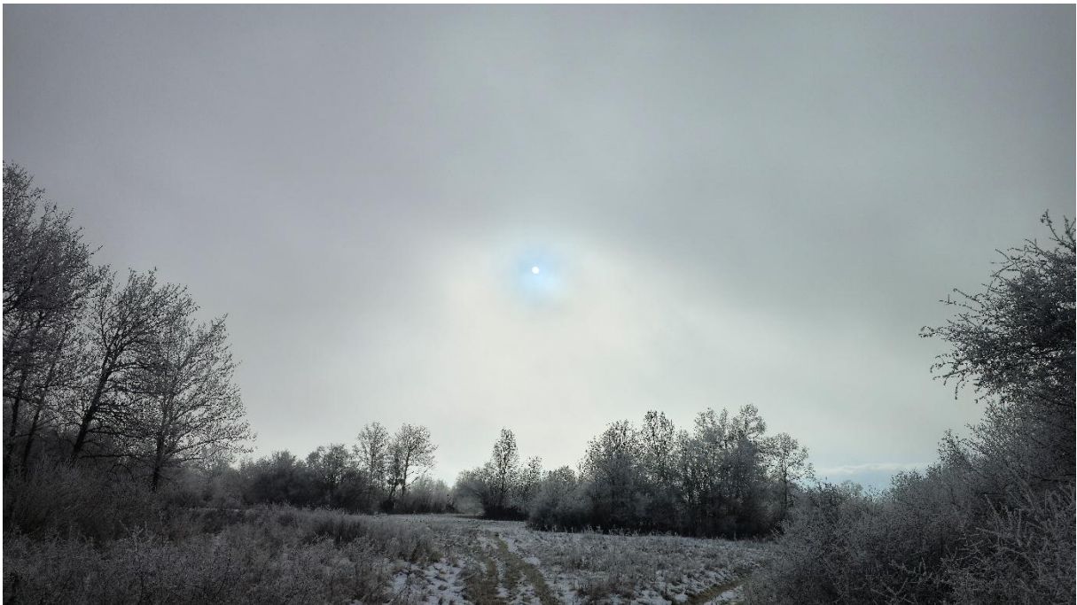
Сунце се пробија из магле над Батрама