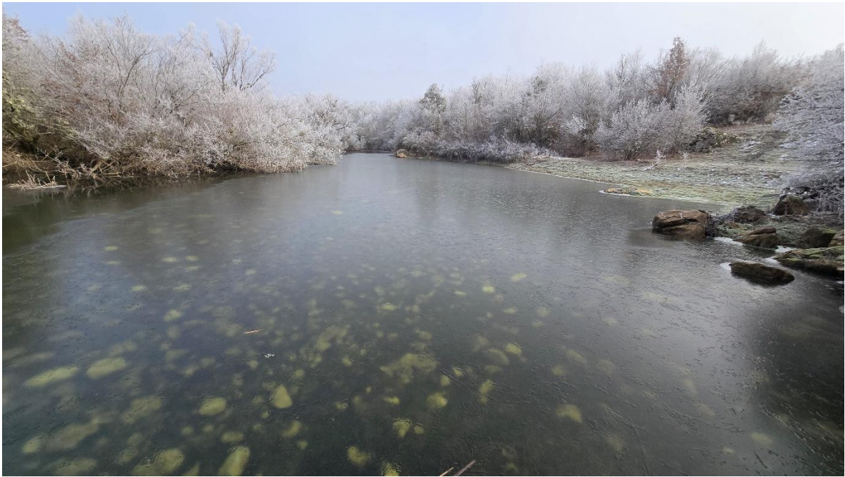
Поглед на Ћоринац