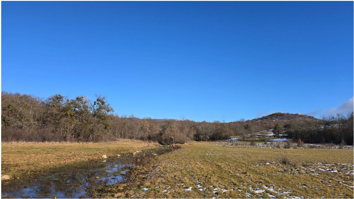
Поглед узводно уз поток, десно је Стражбеница.