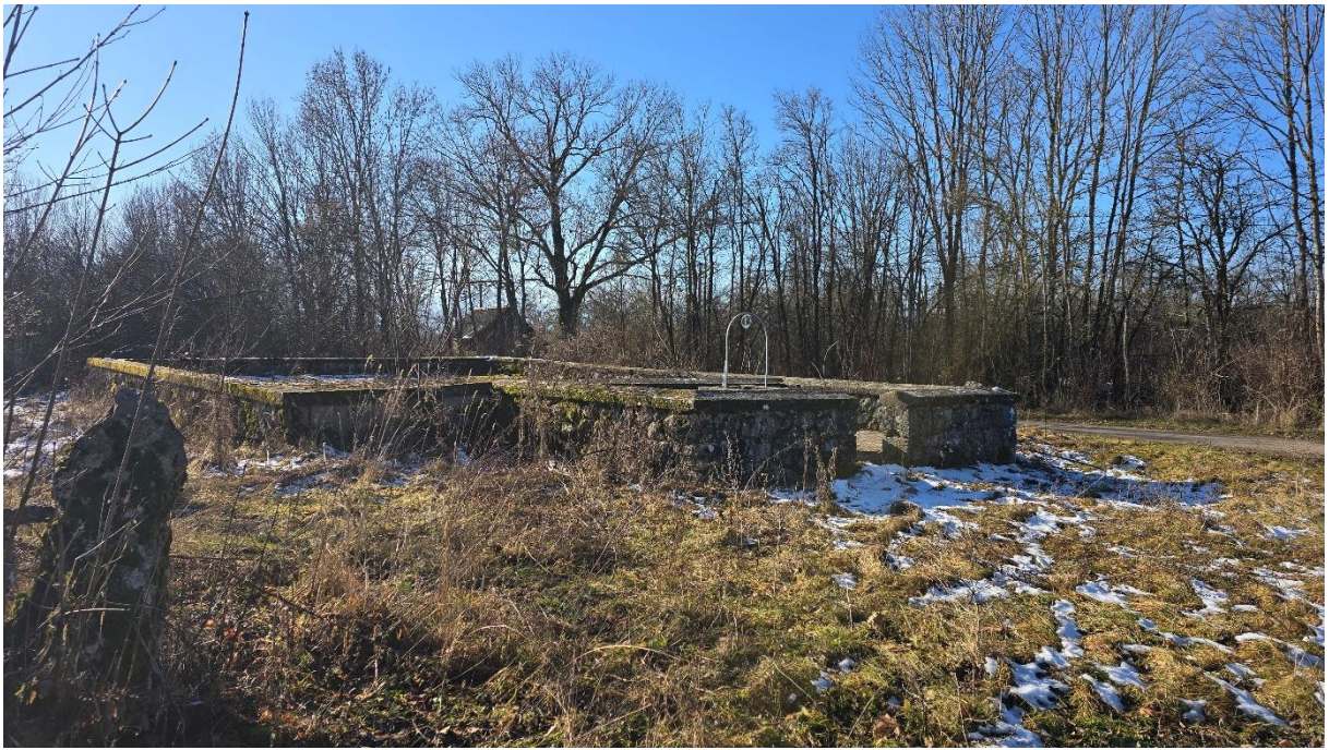
...код Милошичине штерне.