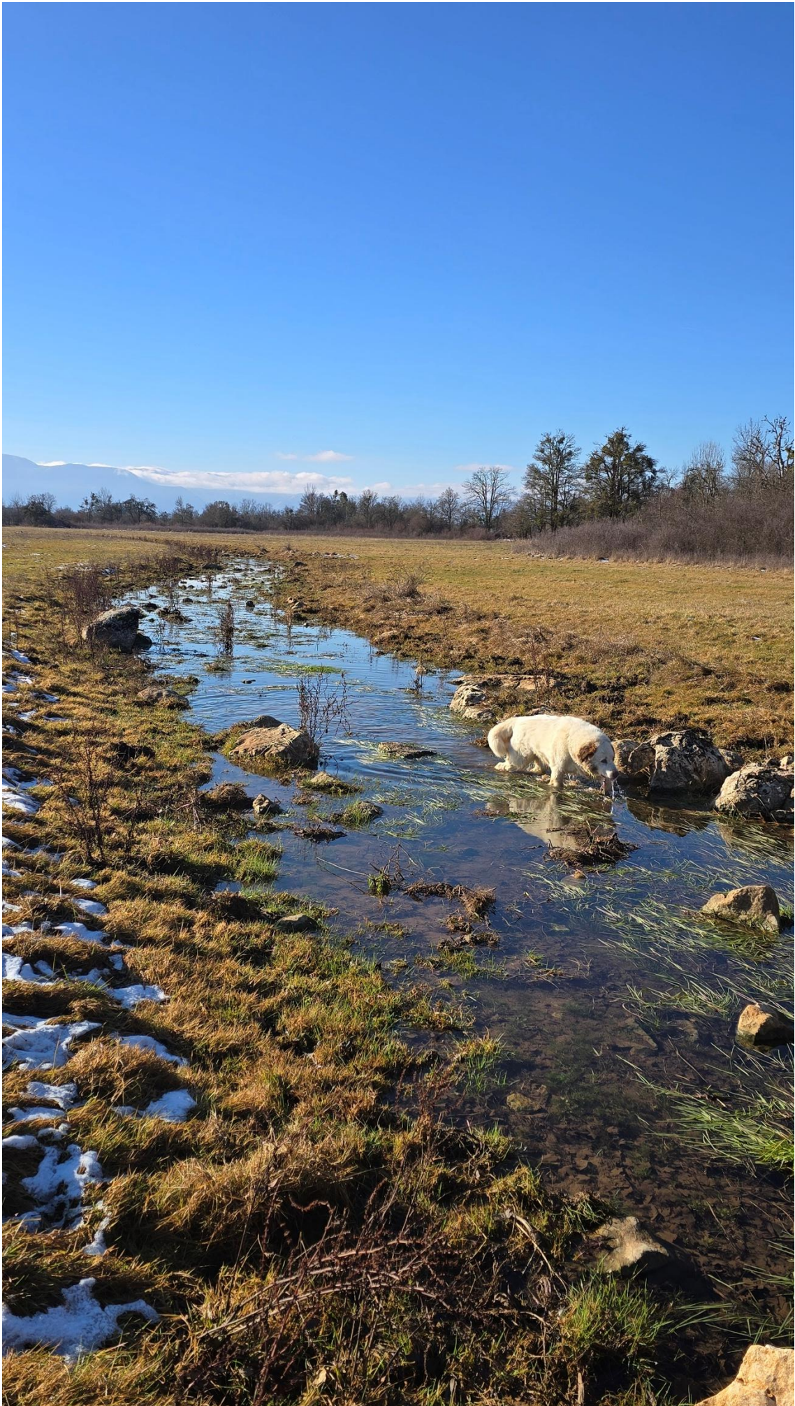
...и напaja водом Ракића поток