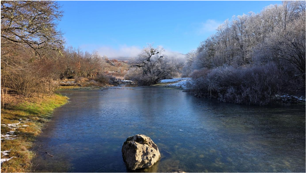
Поглед на Саставке према главном току.