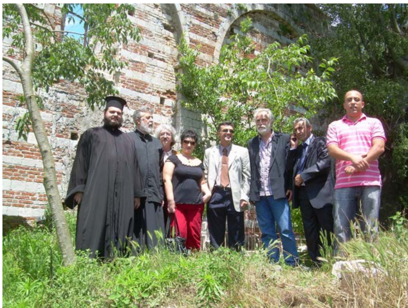
У посети манастиру Јелене Балшић, гости и домаћини

Крај нашег боравка крунисан је посетом манастиру који је у средњем веку саградила Јелена Балшић. Налази се ободу средње Албаније, поред самог Дрима. Уз пут, макадамом, испуцалим друмовима без асфалта, по глибу и рупама, разгледали смо сиве бетонске Енвер-хоџине бункере. Има их много... још стоје прогутани у шибљу или заробљени у мочварном терену. Пођосмо сви до древног манастира Јелене Балшић, али пошто је пут био тешко проходан, до краја стигосмо нас деветоро, потрпани у пространи цип Митрополије. Од манастира је остао скоро нетакнут спољашњи, темељни зид – да пркоси времену, као опомена, или зов из далеке историје. А Дрим је хитао да се сретне са Бојаном.