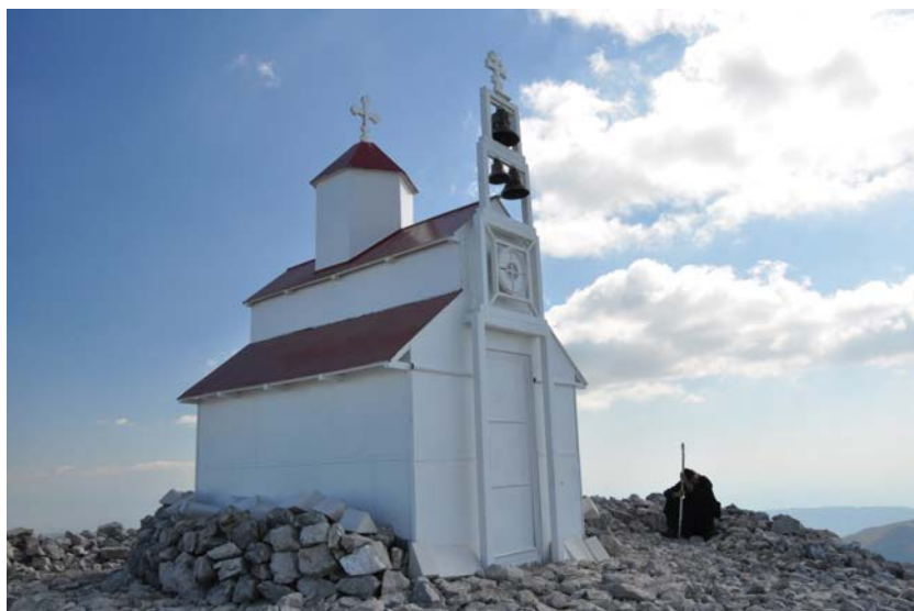
Црква Св. Тројице на Румији

крст, кога носи члан породице Андровић, иза њега иде православни свештеник, и остали верници. Међу походницима су традиционално и католици и муслимани тог краја. Учесници у поворци пјевају: „Крста носим, Бога молим, Господи помилуј”.