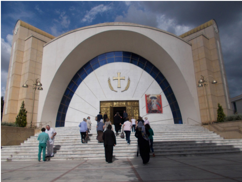
Саборни храм у Тирани, где се налази једна подлактица Св. Јована Владимира и део моштију Св. Козме Етолског

Тивот српског краља био је у време злогласног Енвера Хоџе изложен пропадању, небризи и понижењу.