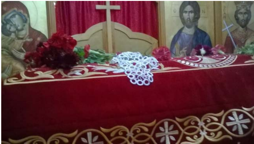
Ђивот са моштима Св. Јована Владимира у цркви у Елбасану, коју је изградио српски краљ

У порти цркве у Елбасану пристиже народ. Почиње бденије у светитељевој цркви. Ту су православни из Тиране, Скадра, Драча, Фира, али и Македоније, Србије, Црне Горе. Као да светитељ сједињује оне који у генима носе истокрвну љубав и корен.