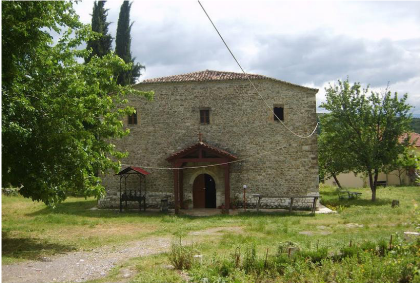
Манастир Светог Јована Владимира у Елбасану, 11. век

Личност краља српскога, Јована Владимира, рођеног 970. и после хиљаду година од његовог мученичког страдања, не престаје да интересује историчаре, архиваре, и науку и цркву.