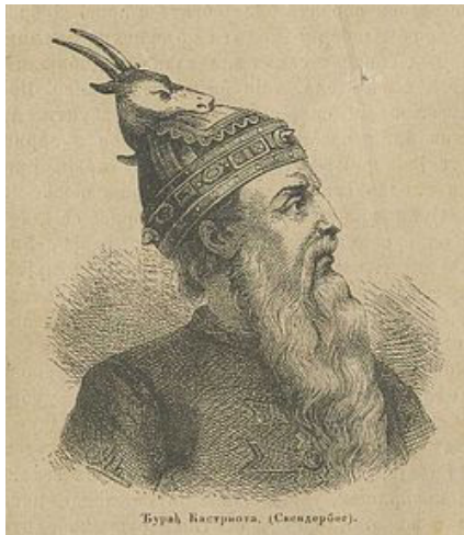
Скендербег –Ђурађ Кастриот

Када су, пре неколико година, Албанци сазнали да је Скендербег Србин и видели стара документа и повеље на српском језику, срушили су му споменик у центру Тиране и уклонили сваки траг. Касније су му споменик понови изградили, јер циљ им је да присвоје туђу земљу, славу и историју! У недостатку албанске средњевековне државе, сопственог идентитета, националних хероја, ова држава је почела са албанизацијом Скендербега и његове побуне, као што то данас покушавају са Св. Јованом Владимиром. Историјски подаци сведоче да је Скендербег био Србин, писао и говорио српским језиком, помагао је манастир Хиландар, као и цела његова породица.