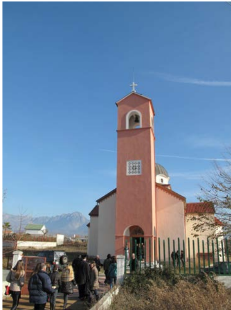
Новоизграђени храм Св. Тројице у селу Врака у близини Скадра