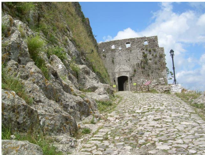
Капија древног Скадар-града

Последњи Мрњавчевић преминуо је у тада стонем Београду, код свог ујака, деспота Стефана Лазаревића. Ма колико да пишемо о прошлости која је богата, мало тога новoga бисмо могли да изнедримо, док се, наравно, не отворе архиве, или нам лондонска Краљевска библиотека, или Конгресна у Вашингтону, не врате наша стара писана документа, или Ватикан, забрањену књигу „Краљевство Словена” аутора Мавра Орбина.