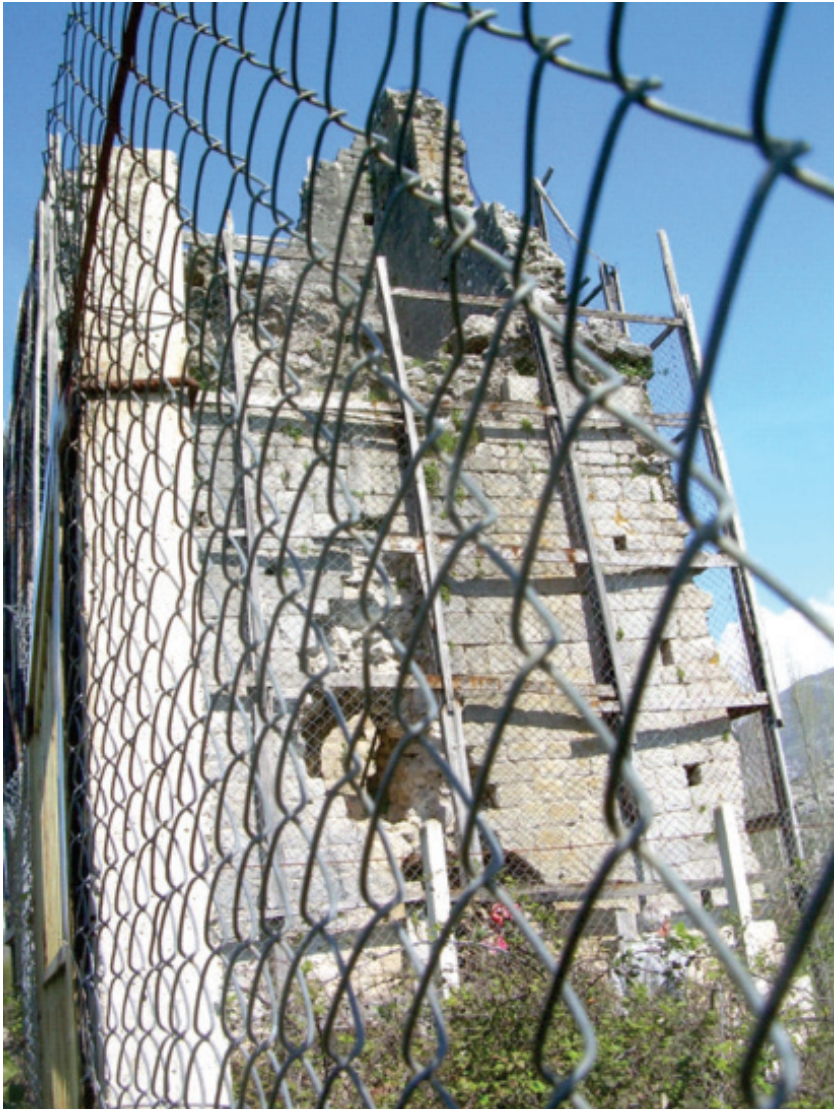
Остаци српске тврђаве на 40 километара од Скадра

13 километара, потом смо организовали чишћење и уређење околног простора богомоље. Звао сам и нашу амбасаду у Тирани, да дођу и да се увере, да нешто заједно учинимо у славу предака.